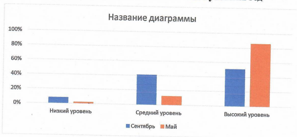
Диаграмма диагностики на 2023-2024 учебный год